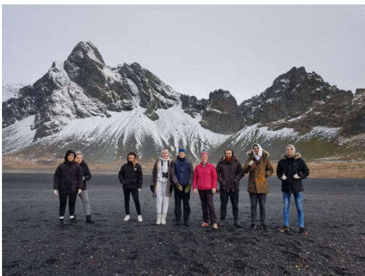
Mynd 1 - Hópurinn sem fór í talninguna.

Margs konar áhöld voru notuð en þau eru eftirtalin: sjónauki, hanskar, teleskóp, ruslapokar, klemmuspjöld og glósubækur.