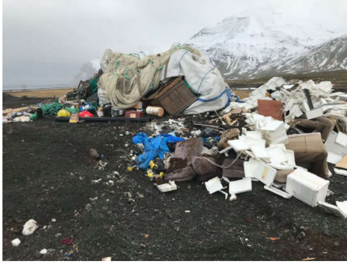
Mynd 2 - Plasthaugurinn sem hópurinn sá.