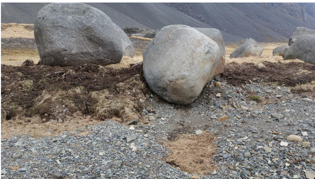
Mynd 3. Styrkur hafíssins hefur ýtt steinunum

Á þessu svæði voru einnig risastórir, hringlaga steinar sem hafís hafði ýtt upp á landið, sem sýnir hve mikill styrkleiki íssins er (sjá mynd 3).