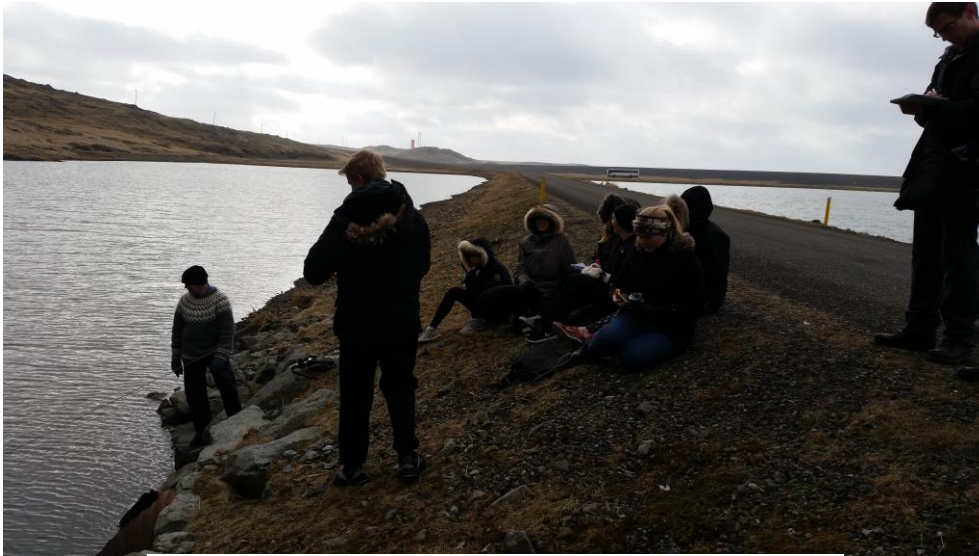
Mynd 2. Sýnistaka við Litla Lónið

Næst var rölt á Stað 2 ( 64^{\circ}24'409\text{N} , 14^{\circ}32'992\text{V} ), eða Litla Lónið. Þar tóku nemendur í sýnahóp sýni ( 64^{\circ}24'526\text{N} , 14^{\circ}33'195\text{V} ) úr vatninu með svifháf, en samtals var háfnum kastað þrisvar í lónið og sýnið látið renna í krukku (sjá mynd 2).